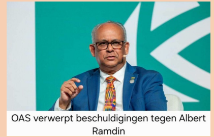
OAS verwerpt beschuldigingen tegen Albert Ramdin Albert Ramdin

De discussie die de afgelopen weken is ontstaan rond OAS-secretaris-generaal Albert Ramdin gaat over meer dan één persoon. Zij raakt aan een fundamentele vraag: welke plaats hebben kleine staten in de internationale besluitvorming? Ramdin werd niet toevallig verkozen tot secretaris-generaal van de Organisatie van Amerikaanse Staten (OAS). Zijn kandidatuur werd voorgedragen door Suriname en unaniem ondersteund door de lidstaten van de Caraïbische Gemeenschap (CARICOM). Daarmee werd voor het eerst in de geschiedenis van de OAS een vertegenwoordiger uit de Caraïbische regio gekozen tot hoogste functionaris van de organisatie.